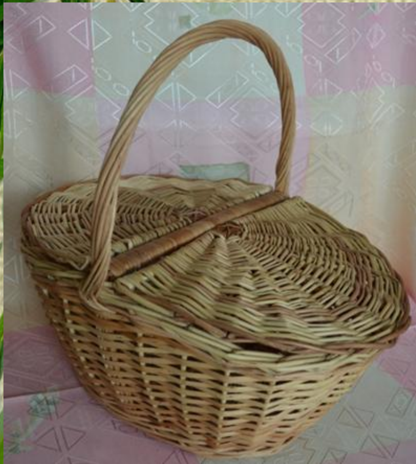
Карзіна з вечкам